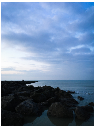
De rand van de rotsen vormt een lijn die je naar achter in het beeld voert. Ze eindigt op 1/3 van het beeld. Daar vind je meteen ook een nieuw element: twee mensen die naar de zee kijken.

In landschappen kan je op zoek gaan naar weggetjes, brugjes, rijen bomen, rivieren en andere lijnen. Je plaatst ze dan zo op de foto dat ze je naar een ander deel in het beeld leiden. Een weggetje leidt je bijvoorbeeld naar achterin het beeld of naar een ander element in de foto. Op die manier creëer je dynamiek.